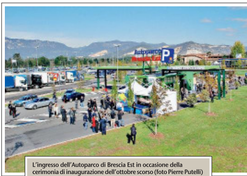
L'ingresso dell'Autoparco di Brescia Est in occasione della cerimonia di inaugurazione dell'ottobre scorso

Insomma, una vera e propria «casa dei tra-