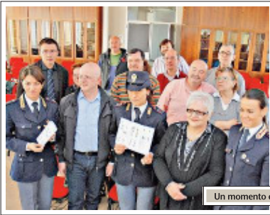
Un momento della presentazione dell'iniziativa in Questura